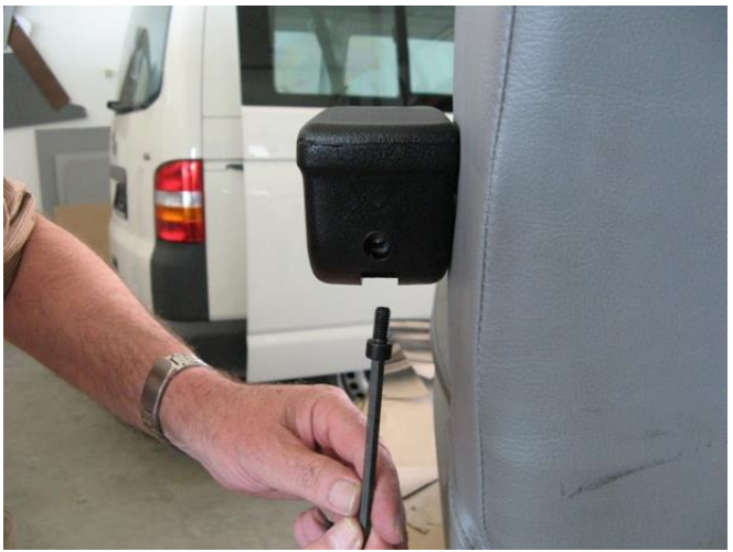
Imbus M8 x 20 von unten einführen und festziehen